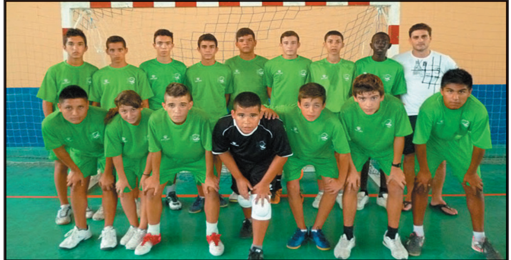
Plantilla actual del conjunto del municipio de Arona, el Cadete Costa Sur